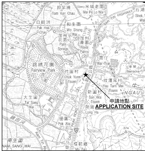
要覽圖 KEY PLAN