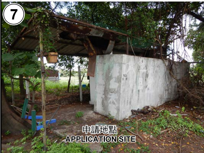
申請地點 APPLICATION SITE