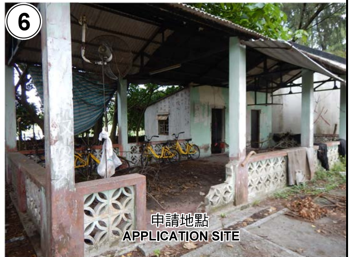
申請地點 APPLICATION SITE