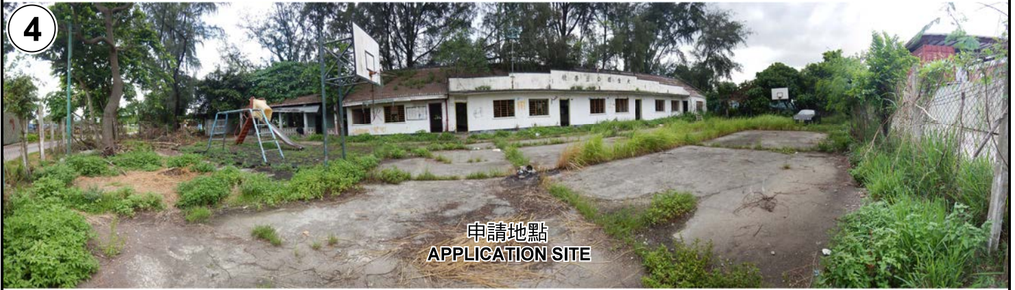
申請地點 APPLICATION SITE