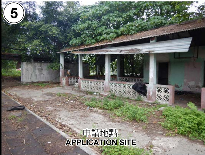
申請地點 APPLICATION SITE