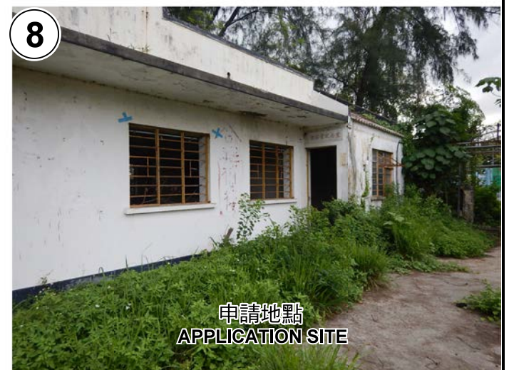
申請地點 APPLICATION SITE