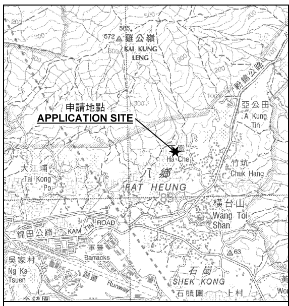
要覽圖 KEY PLAN SCALE 1:50 000 比例尺