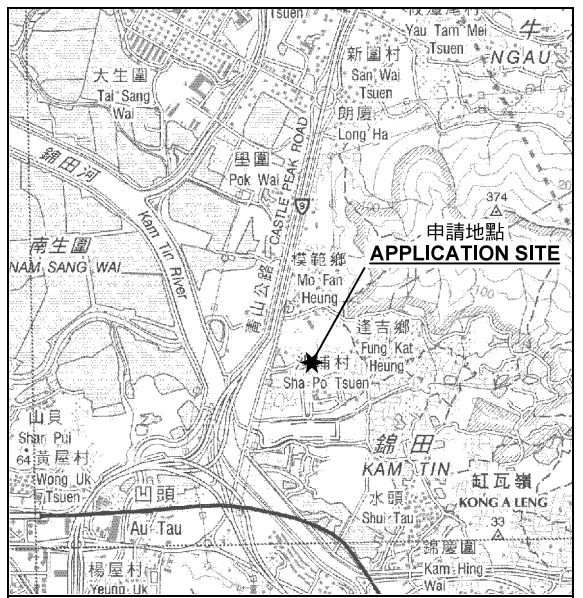
要覽圖 KEY PLAN SCALE 1 : 50 000 比例尺

申請地點界線只作識別用 APPLICATION SITE BOUNDARY FOR IDENTIFICATION PURPOSE ONLY