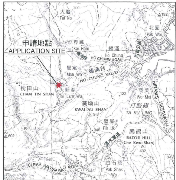
要覽圖 KEY PLAN SCALE 1 : 50 000 比例尺

申請地點界線只作識別用 APPLICATION SITE BOUNDARY FOR IDENTIFICATION PURPOSE ONLY