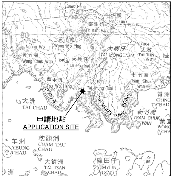
要覽圖 KEY PLAN SCALE 1 : 50 000 比例尺