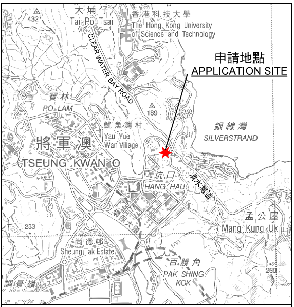
要覽圖 KEY PLAN SCALE 1 : 50 000 比例尺

申請地點界線只作識別用 APPLICATION SITE BOUNDARY FOR IDENTIFICATION PURPOSE ONLY