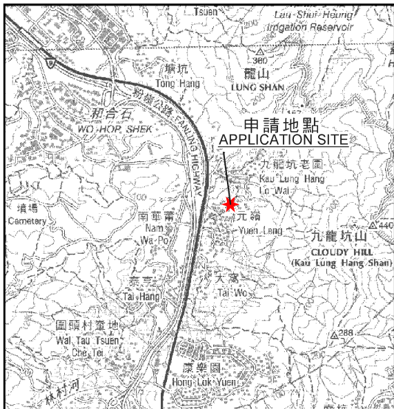
要覽圖 KEY PLAN