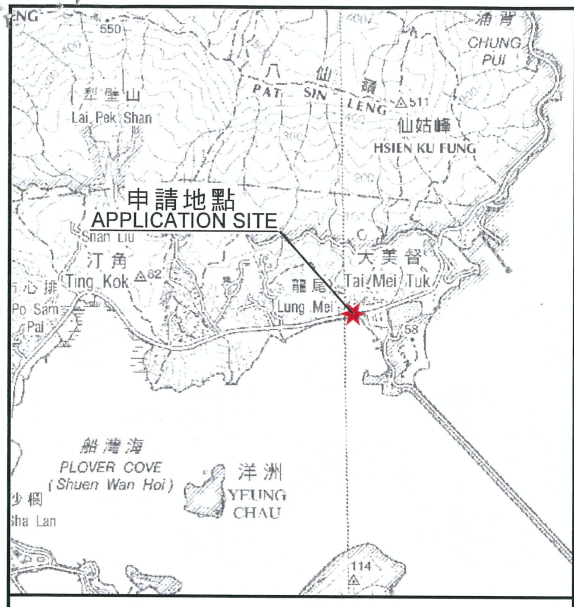
要覽圖 KEY PLAN