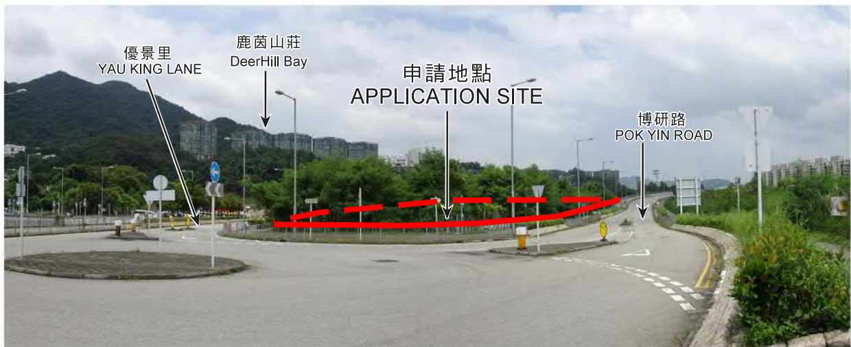
申請地點界線只作識別用 APPLICATION SITE BOUNDARY FOR IDENTIFICATION PURPOSE ONLY