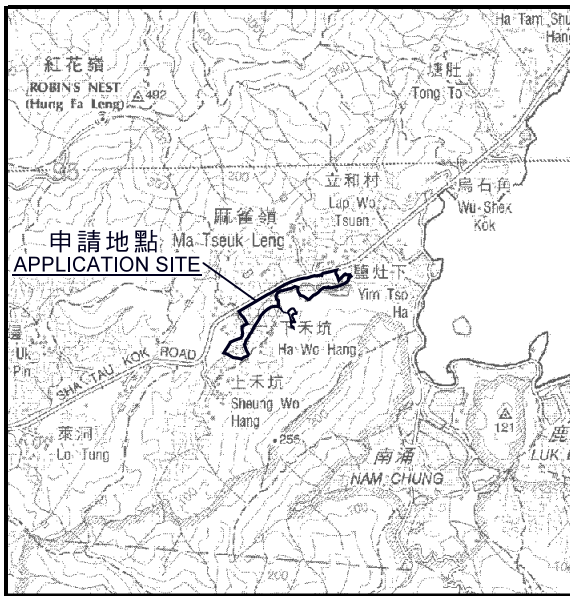
要覽圖 KEY PLAN SCALE 1 : 50 000 比例尺