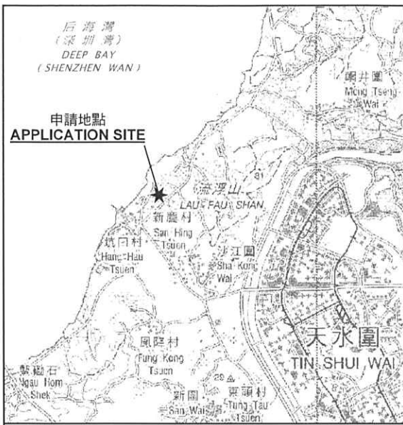
要覽圖 KEY PLAN