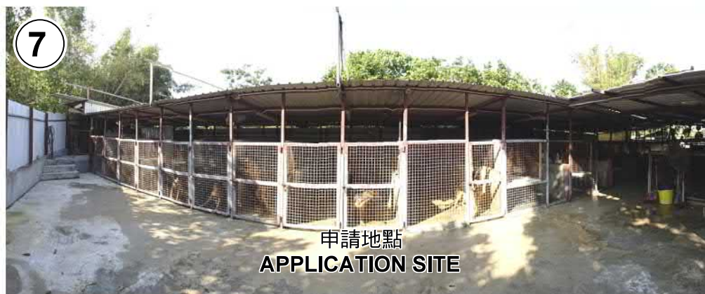
申請地點 APPLICATION SITE

本圖於2019年2月12日擬備，所根據的資料為攝於2019年1月25日的實地照片 PLAN PREPARED ON 12.2.2019 BASED ON SITE PHOTOS TAKEN ON 25.1.2019