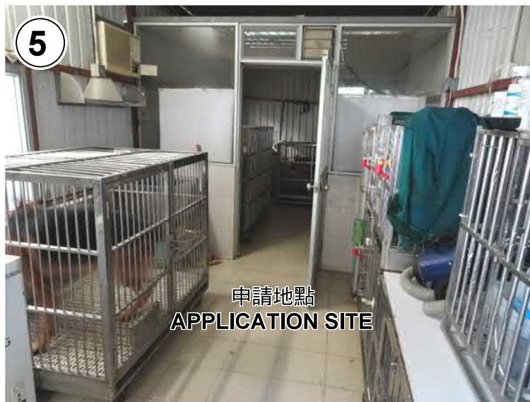
申請地點 APPLICATION SITE