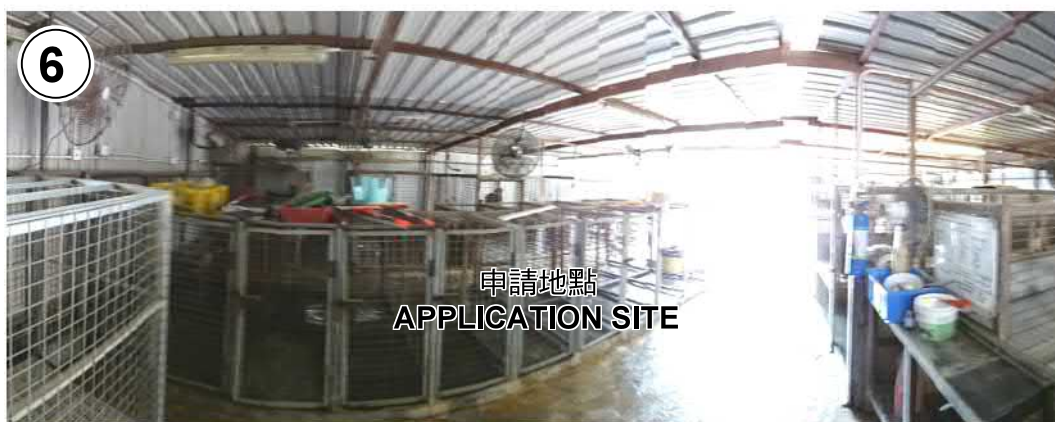
申請地點 APPLICATION SITE