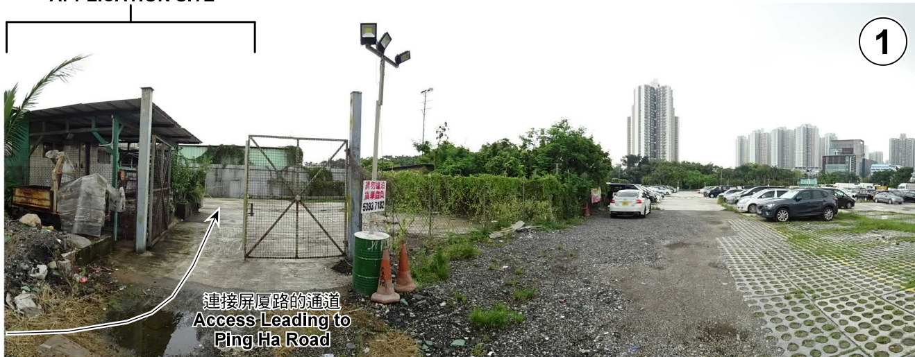
連接屏厦路的通道 Access Leading to Ping Ha Road