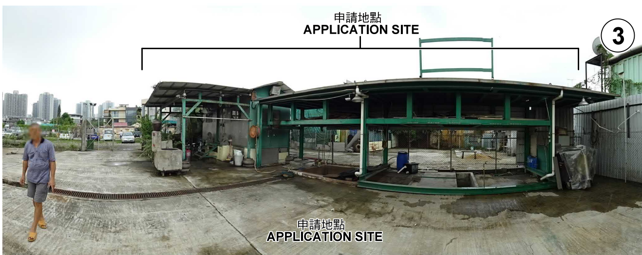
申請地點 APPLICATION SITE

申請地點界線只作識別用 APPLICATION SITE BOUNDARY FOR IDENTIFICATION PURPOSE ONLY