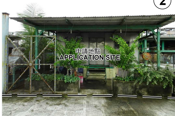
申請地點 APPLICATION SITE