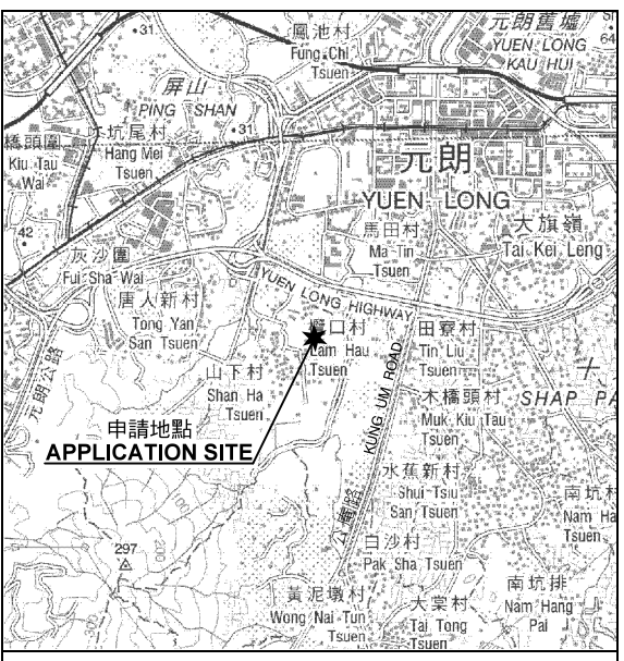
要覽圖 KEY PLAN SCALE 1 : 50 000 比例尺