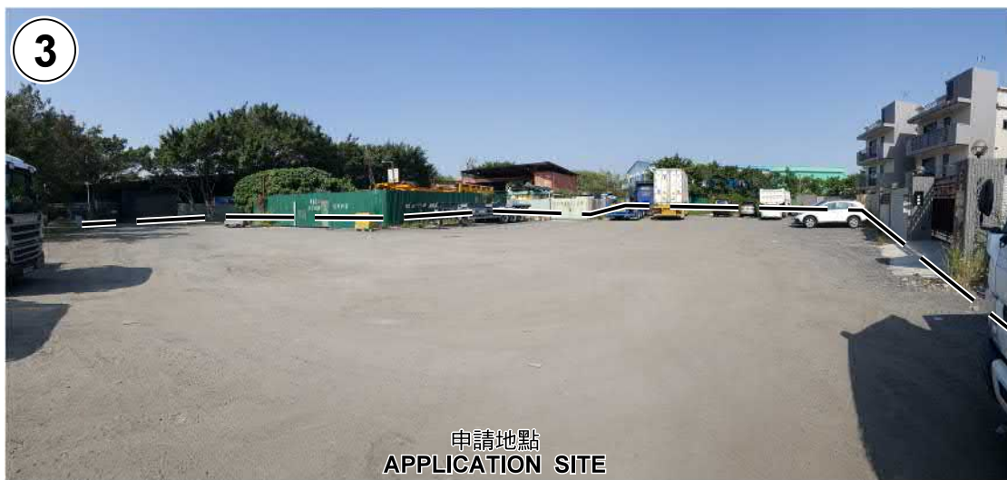
申請地點界線只作識別用 APPLICATION SITE BOUNDARY FOR IDENTIFICATION PURPOSE ONLY