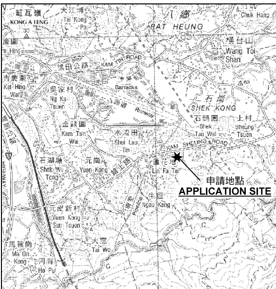
要覽圖 KEY PLAN