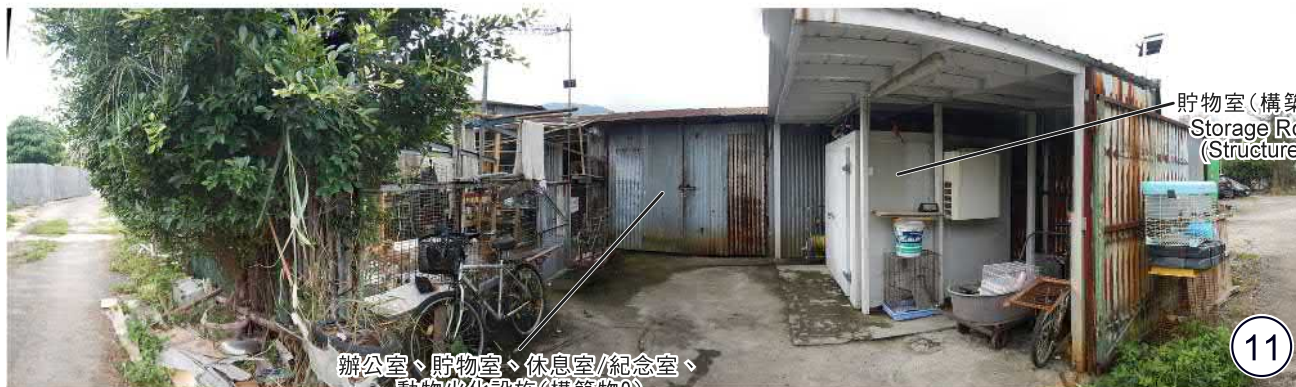
辦公室、貯物室、休息室/紀念室、 動物火化設施(構築物9) Office, Storage Room, Rest Room/Memorial Room, Animal Crematorium Facilities (Structure 9)