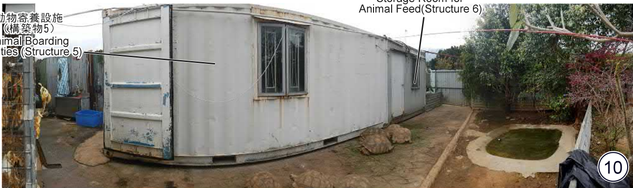
動物飼料貯物室 (構築物6) Storage Room for Animal Feed (Structure 6)