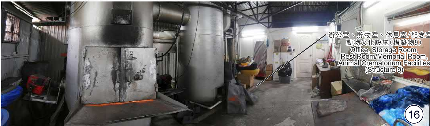
辦公室、貯物室、休息室/紀念室、 動物火化設施(構築物9) Office, Storage Room, Rest Room/Memorial Room, Animal Crematorium Facilities (Structure 9)