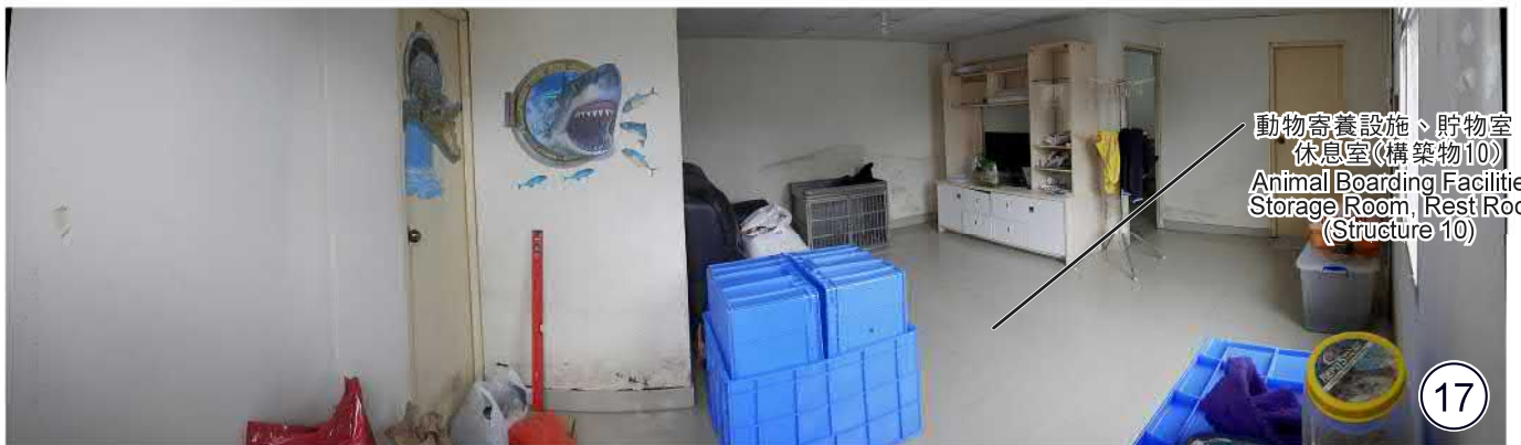
動物寄養設施、貯物室、 休息室(構築物10) Animal Boarding Facilities, Storage Room, Rest Room (Structure 10)

就構築物編號1至10的位置，請參考城規會文件編號第10649號中附件A的繪圖編號A-1