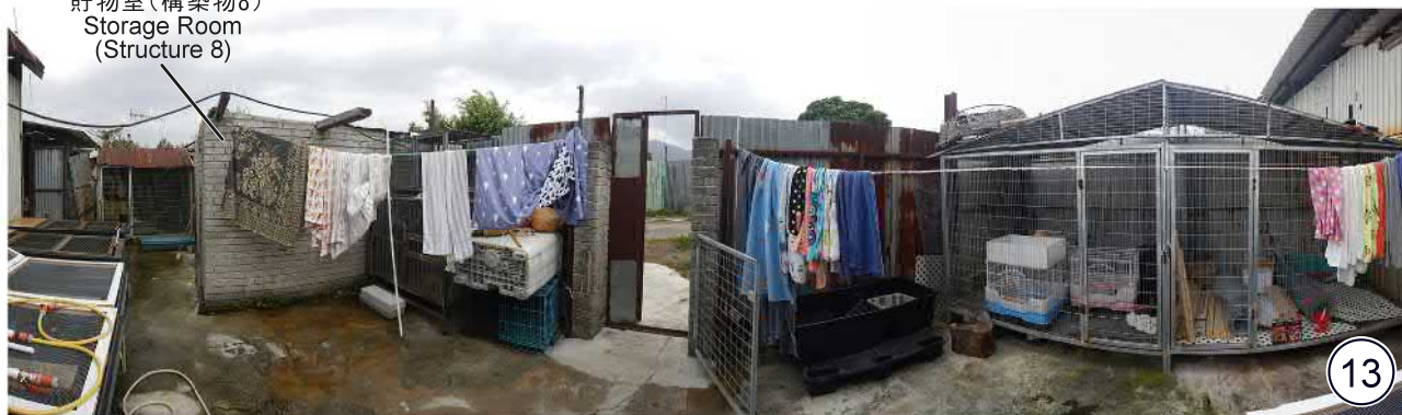
貯物室(構築物8) Storage Room (Structure 8)