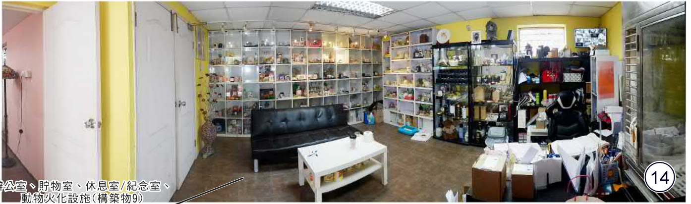
辦公室、貯物室、休息室/紀念室、 動物火化設施(構築物9) Office, Storage Room, Rest Room/Memorial Room, Animal Crematorium Facilities (Structure 9)