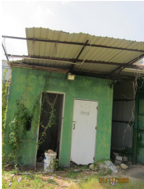
Photo taken on 1.11.2020