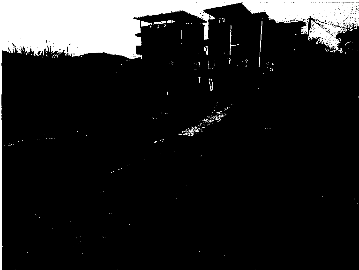
通往申請場地的車路圖示