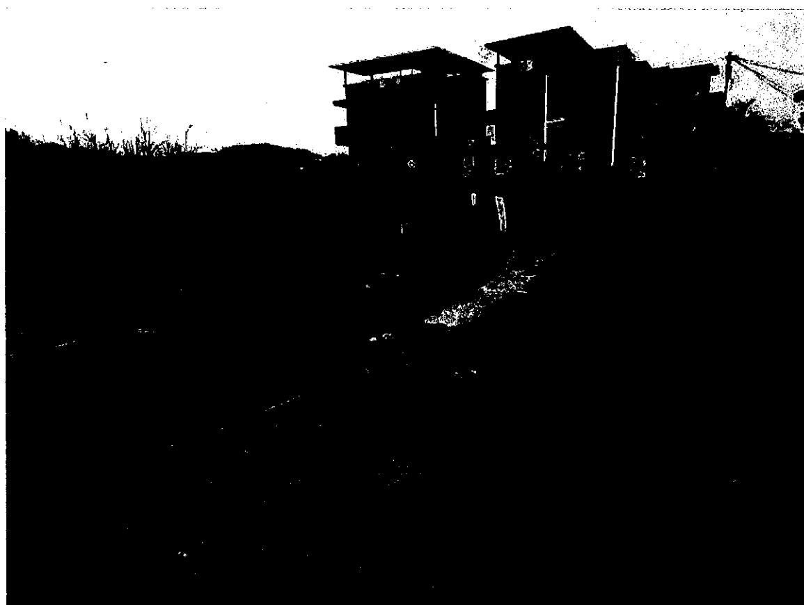
通往申請場地的車路圖示