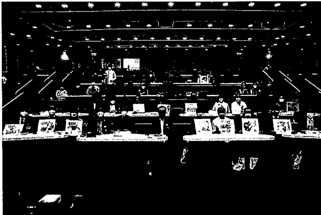
舉辦莊子研討會議