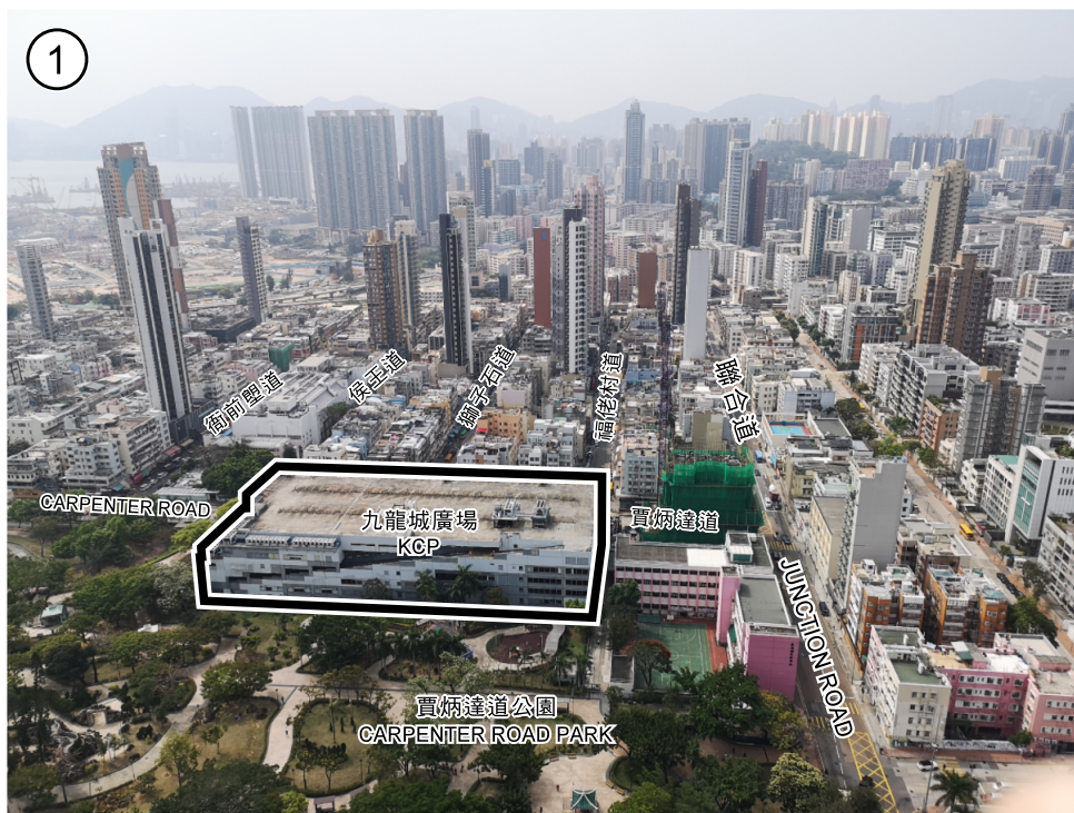
項目 A ITEM A