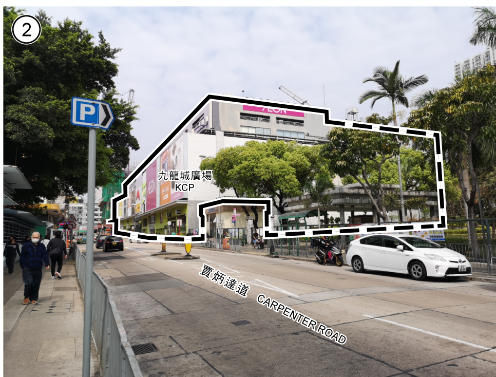
項目 A 及 B ITEMS A AND B

界線只作識別用 BOUNDARY FOR IDENTIFICATION PURPOSE ONLY