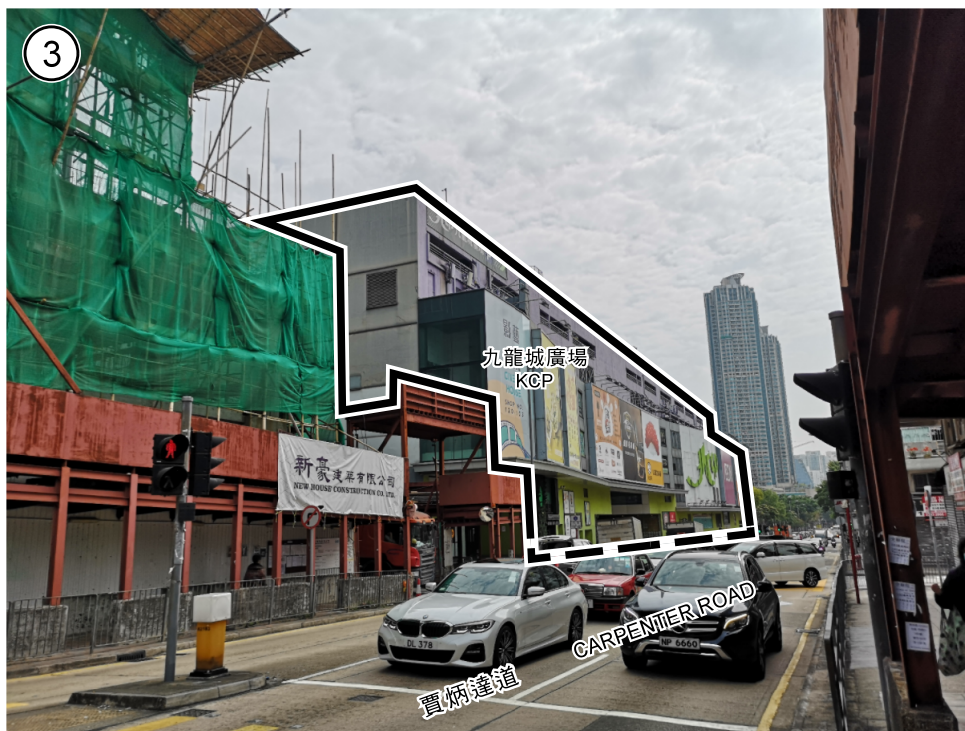
項目 A 及 B ITEMS A AND B