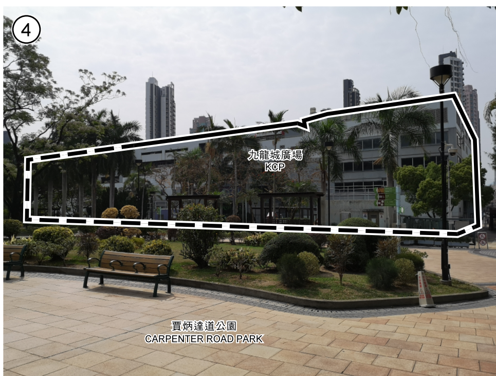
項目 A ITEM A

界線只作識別用 BOUNDARY FOR IDENTIFICATION PURPOSE ONLY