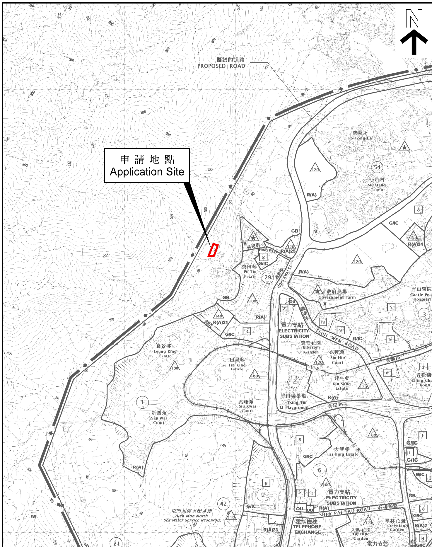
位置圖 LOCATION PLAN

本摘要圖於2022年1月21日擬備， 所根據的資料為於2018年12月11日 核准的分區計劃大綱圖編號 S/TM/35 EXTRACT PLAN PREPARED ON 21.1.2022 BASED ON OUTLINE ZONING PLAN No. S/TM/35 APPROVED ON 11.12.2018