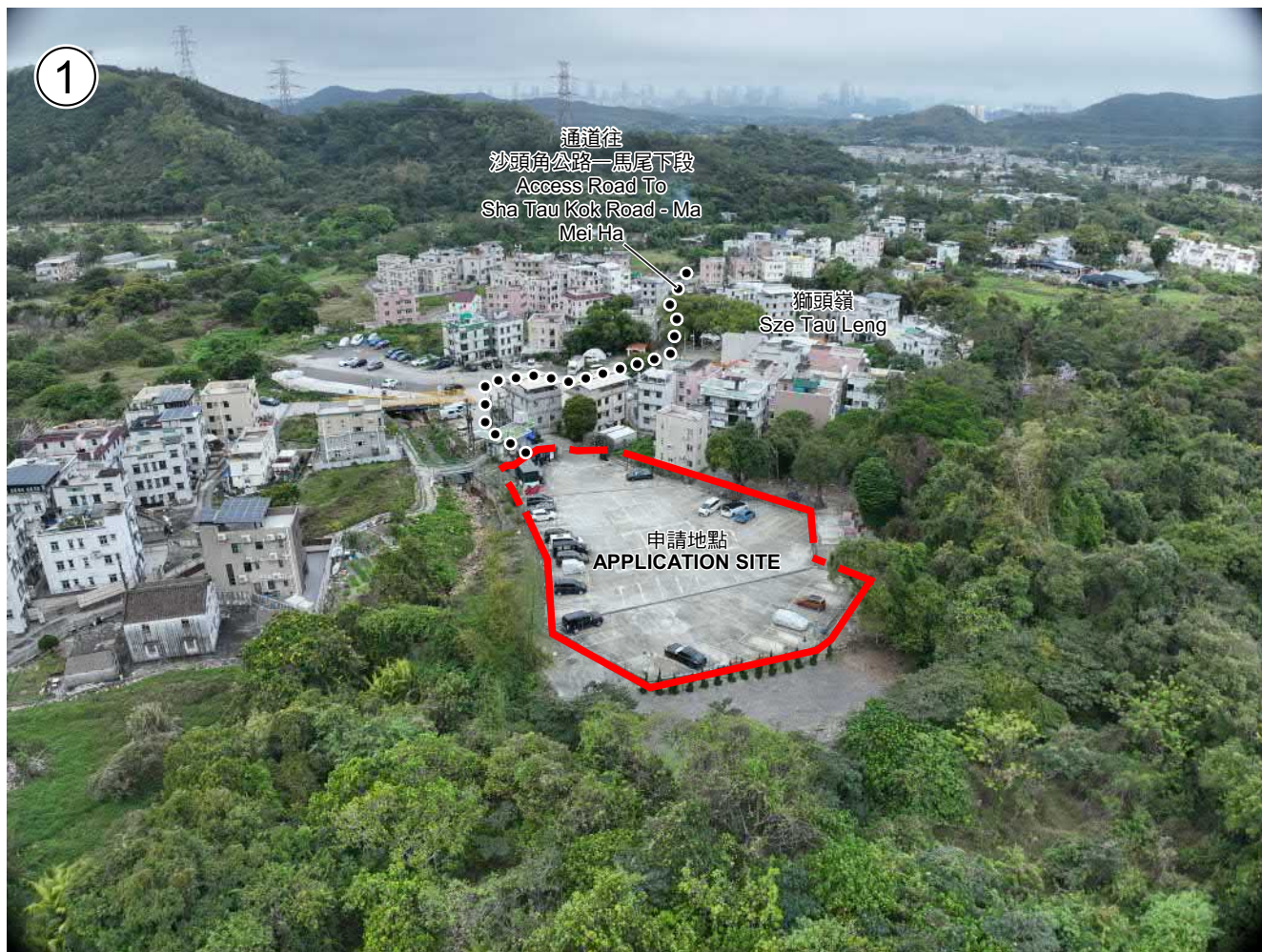
攝於2025年3月14日的實地照片 SITE PHOTO TAKEN ON 14.3.2025