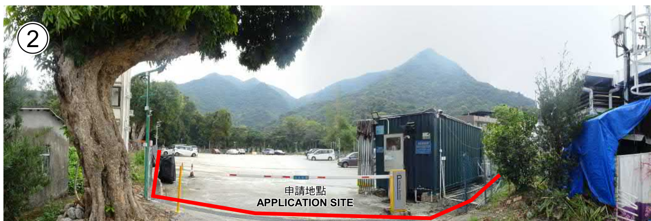
攝於2025年3月18日的實地照片 SITE PHOTO TAKEN ON 18.3.2025

申請地點界線只作識別用 APPLICATION SITE BOUNDARY FOR IDENTIFICATION PURPOSE ONLY