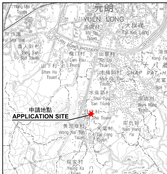
要覽圖 KEY PLAN