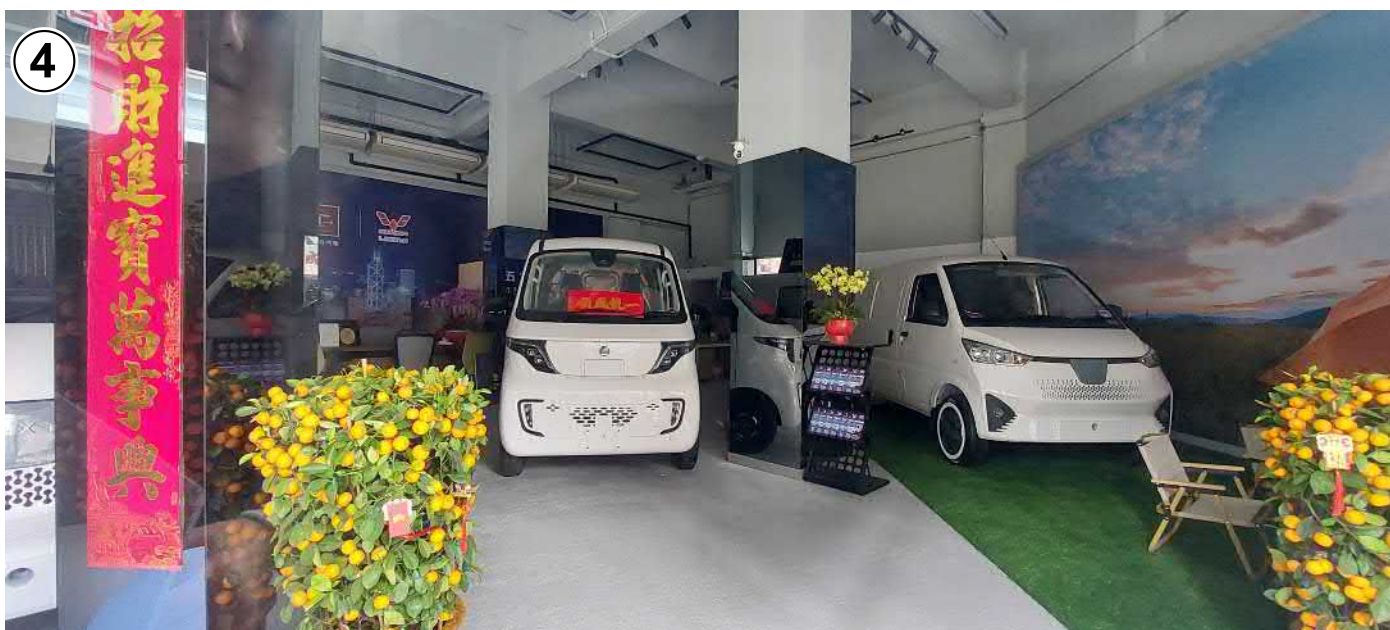
申請處所內部 INTERIOR OF THE APPLICATION PREMISES

擬議商店及服務行業(約126.5平方米)以及 擬議商店及服務行業(銀行、快餐櫃檯、電氣工程店、士多或陳列室)(約208.8平方米) 九龍新蒲崗三祝街10號正華工業大廈地下(部分) PROPOSED 'SHOP AND SERVICES' USE (ABOUT 126.5 SQ.M) AND PROPOSED 'SHOP AND SERVICES (BANK, FAST FOOD COUNTER, ELECTRICAL SHOP, LOCAL PROVISIONS STORE OR SHOWROOM)' (ABOUT 208.8 SQ.M) PORTION OF G/F, JING WAH BUILDING, 10 SAM CHUK STREET, SAN PO KONG, KOWLOON