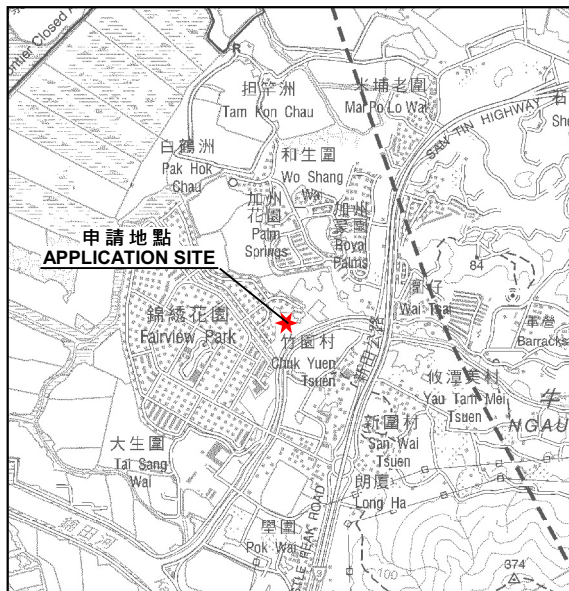
要覽圖 KEY PLAN SCALE 1 : 50 000 比例尺