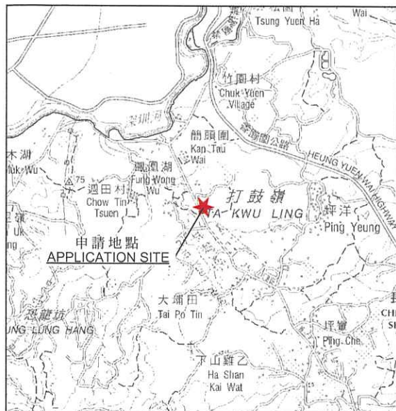
要覽圖 KEY PLAN SCALE 1:50 000 比例尺