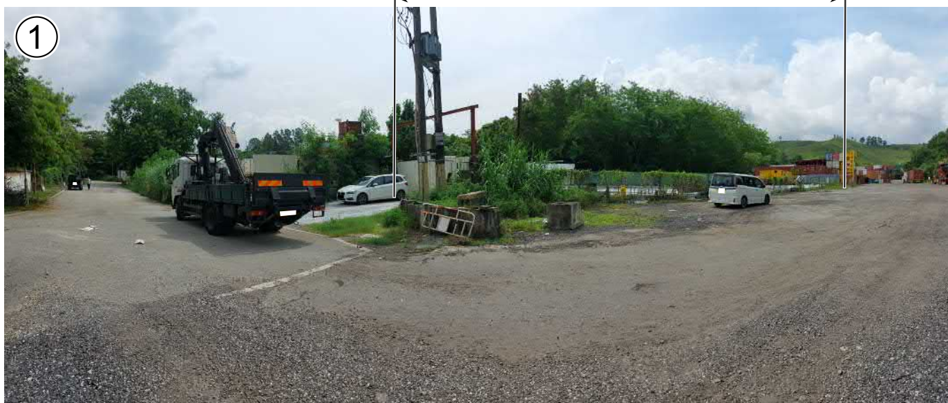
申請地點 APPLICATION SITE