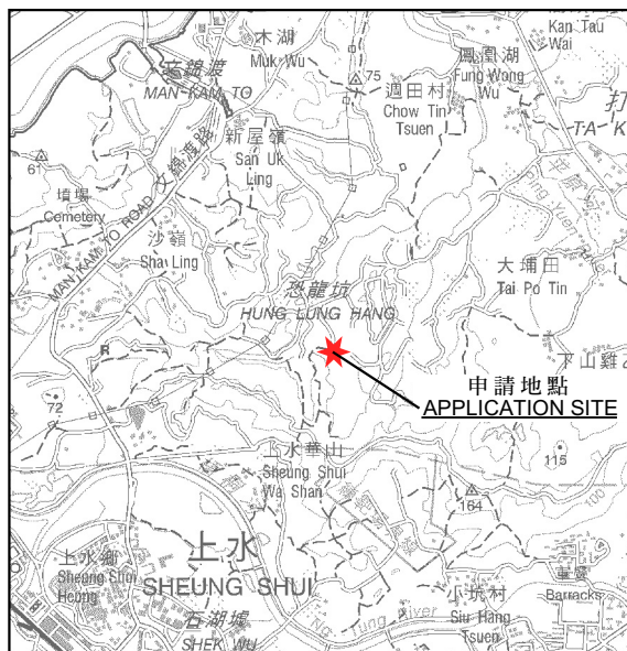
要覽圖 KEY PLAN