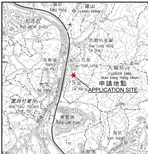
要覽圖 KEY PLAN