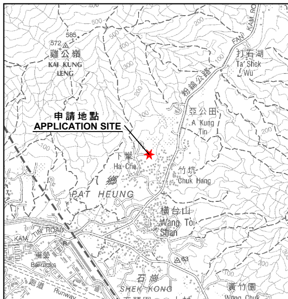
要覽圖 KEY PLAN SCALE 1: 50 000 比例尺