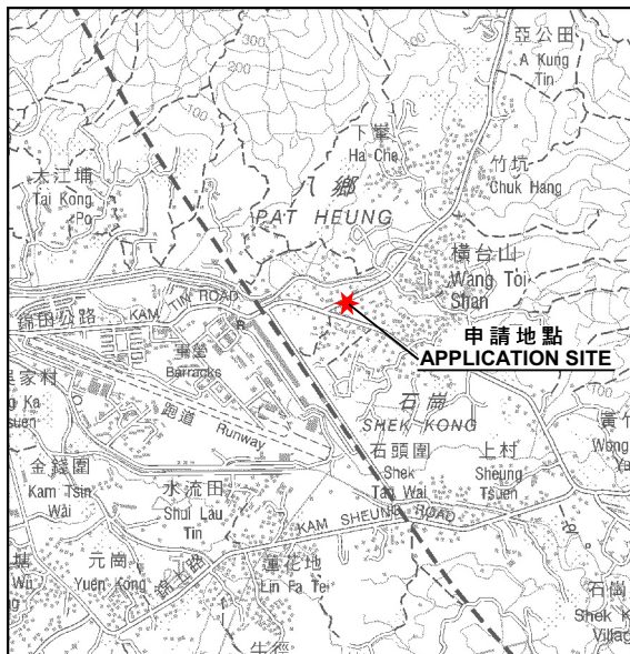
要覽圖 KEY PLAN