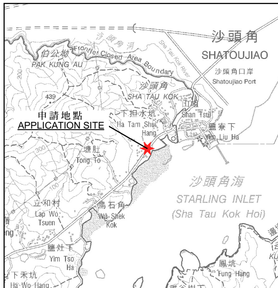
要覽圖 KEY PLAN SCALE 1:50 000 比例尺