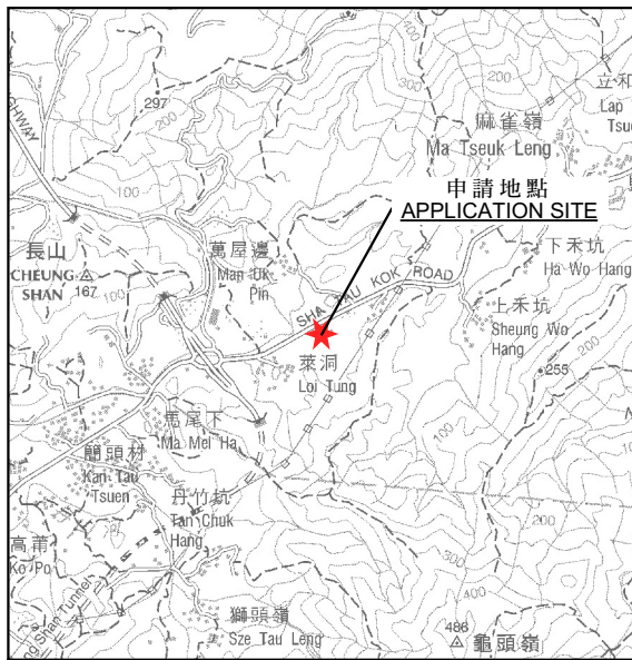
要覽圖 KEY PLAN SCALE 1:50 000 比例尺