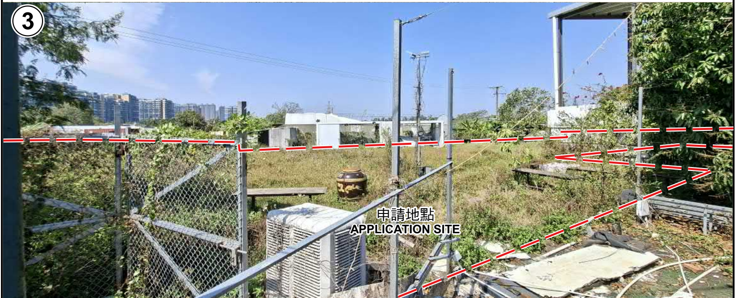
申請地點界線只作識別用 APPLICATION SITE BOUNDARY FOR IDENTIFICATION PURPOSE ONLY