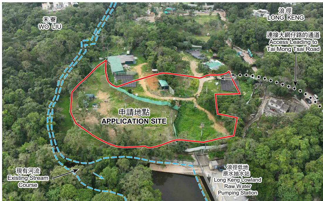
攝於2026年5月11日S17覆核申請期間的無人駕駛航拍照片 UNMANNED AERIAL VEHICLE (UAV) PHOTO TAKEN DURING S17 REVIEW APPLICATION ON 11.5.2026

界線只作識別用 BOUNDARY FOR IDENTIFICATION PURPOSE ONLY