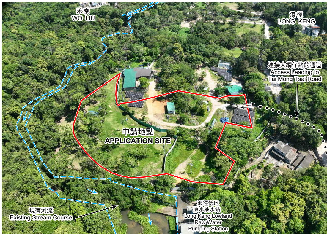
攝於2025年7月25日S16申請期間的無人駕駛航拍照片 UNMANNED AERIAL VEHICLE (UAV) PHOTO TAKEN DURING S16 APPLICATION ON 25.7.2025