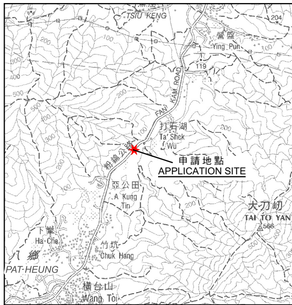
要覽圖 KEY PLAN SCALE 1:50 000 比例尺