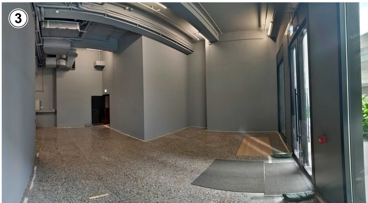
申請處所內部 INTERIOR OF THE APPLICATION PREMISES

擬議商店及服務行業 新蒲崗六合街 21 號地下（部分）的工場 （新九龍內地段第 4 8 7 3 號） PROPOSED SHOP AND SERVICES WORKSHOP SPACE, G/F (PORTION), 21 LUK HOP STREET, SAN PO KONG, (NEW KOWLOON INLAND LOT No. 4873)