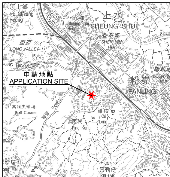
要覽圖 KEY PLAN