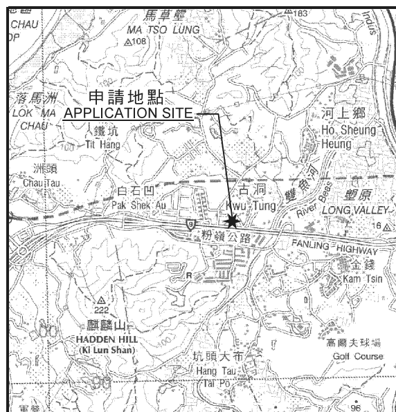
要覽圖 KEY PLAN