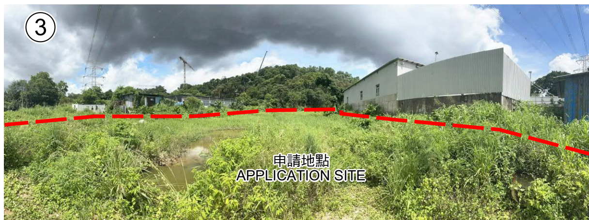
攝於2024年6月24日的實地照片 SITE PHOTOS TAKEN ON 24.6.2024

申請地點界線只作識別用 APPLICATION SITE BOUNDARY FOR IDENTIFICATION PURPOSE ONLY