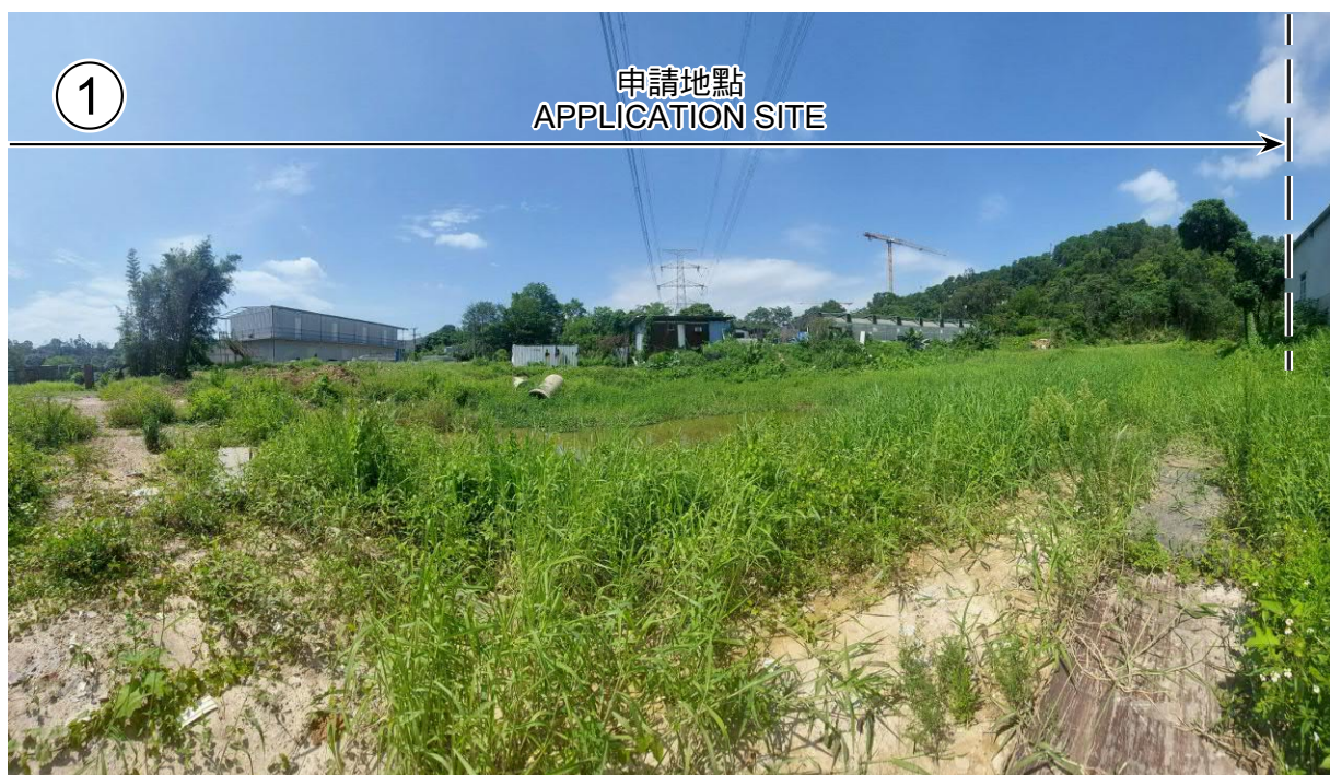
攝於2024年5月17日的實地照片 SITE PHOTO TAKEN ON 17.5.2024