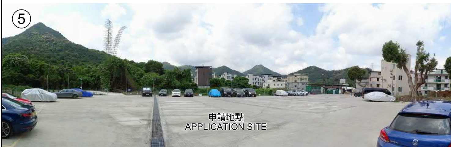
申請地點 APPLICATION SITE

本圖於2022年5月5日擬備， 所根據的資料為攝於2022年4月26日 的實地照片