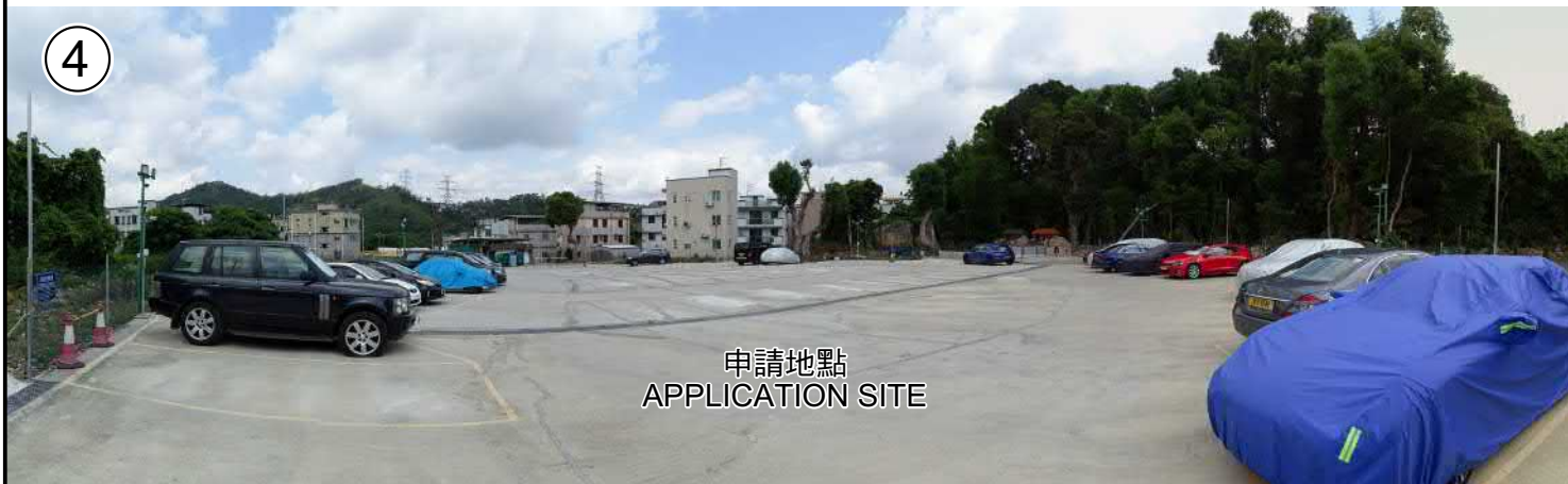
申請地點 APPLICATION SITE