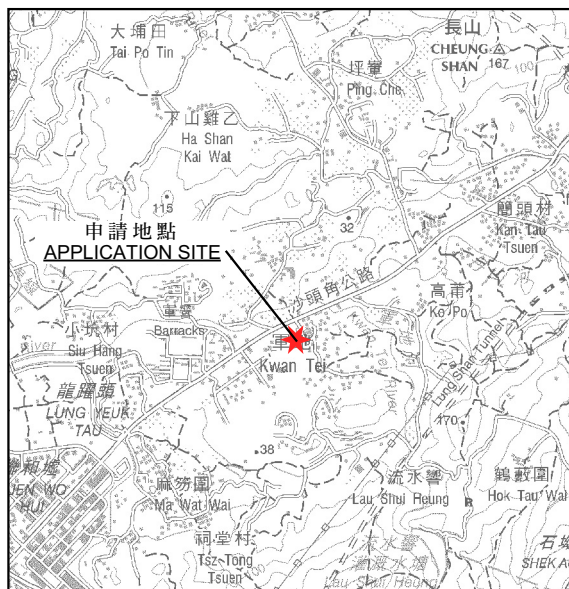
要覽圖 KEY PLAN SCALE 1:50,000 比例尺