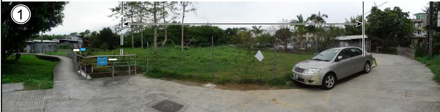
攝於2022年11月22日的實地照片 SITE PHOTO TAKEN ON 22.11.2022