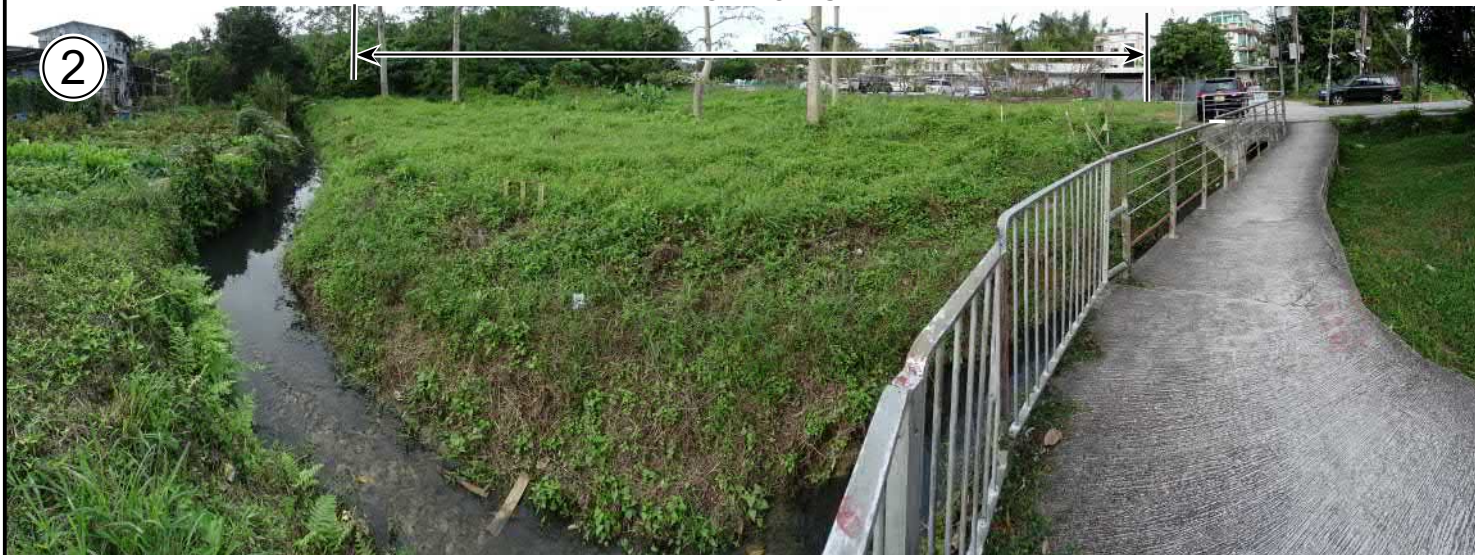
攝於2022年12月2日的實地照片 SITE PHOTO TAKEN ON 2.12.2022

擬議臨時公眾停車場(只限停泊私家車及輕型貨車)(為期3年) 新界粉嶺軍地丈量約份第83約地段第466號(部分) PROPOSED TEMPORARY PUBLIC VEHICLE PARK (PRIVATE CARS AND LIGHT GOODS VEHICLES ONLY) FOR A PERIOD OF 3 YEARS LOT 466 (PART) IN D.D.83, KWAN TEI, FANLING, N.T.