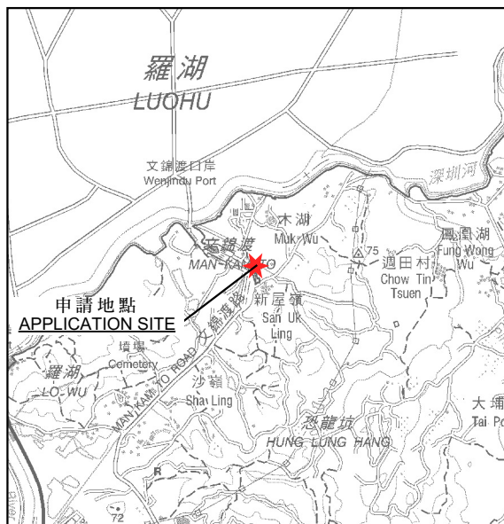
要覽圖 KEY PLAN SCALE 1:50 000 比例尺