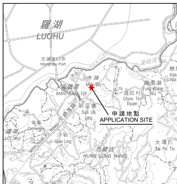
SCALE 1:50 000 比例尺