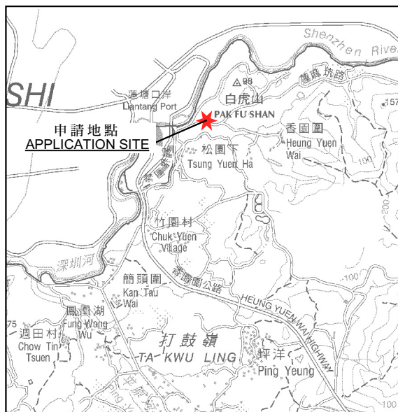
SCALE 1:50,000 比例尺