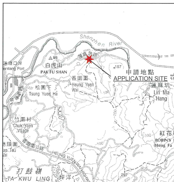
要覽圖 KEY PLAN