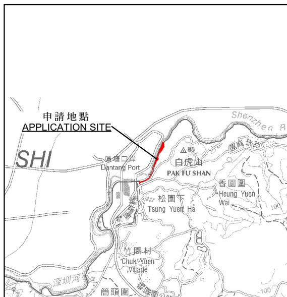
要覽圖 KEY PLAN