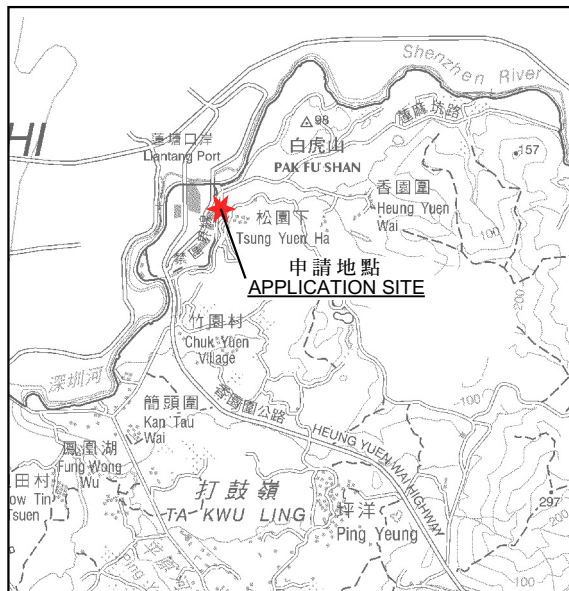
要覽圖 KEY PLAN SCALE 1:50,000 比例尺